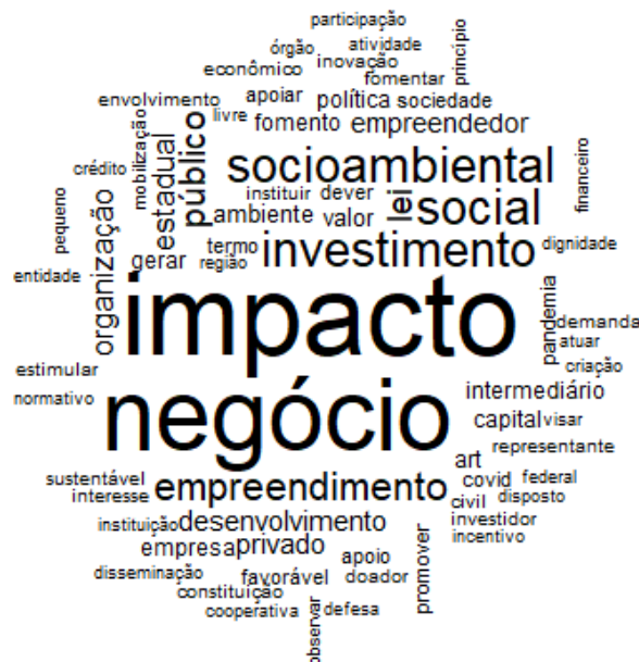
Figura 1 - Nuvem de Palavras

As legislações subnacionais de investimentos e negócios de impacto do Rio Grande do Norte (2019), do Rio de Janeiro (2019), de Minas Gerais (2020), do Distrito Federal (2021), de Pernambuco (2021) e de Alagoas (2021) constituem um corpus textual, com seis textos (legislações subnacionais), com 127 segmentos, um total de 4.605 termos e 206 hápax (termos que aparecem apenas uma vez). Após o processamento dos dados no software Iramuteq o primeiro esquema gráfico apresentado é a nuvem de palavras das legislações subnacionais (Figura 1):